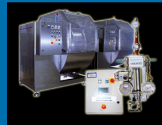
Impianto tipo - Typical plant