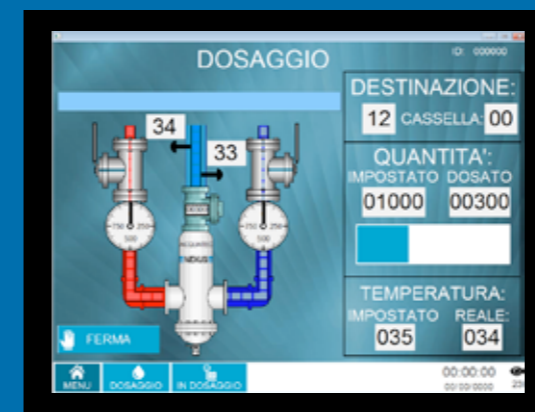
Terminale operatore - Operator terminal

Sistema completamente automatico per dosaggio e miscelazione di acqua verso le utenze stabilite, effettuando carichi d'acqua verso bottalini di campionatura, garantendo precisione in temperatura e in quantità. Il sistema può anche essere inserito in una rete dati, e di conseguenza eseguire dosaggi "dettati" da sistemi computerizzati remoti.